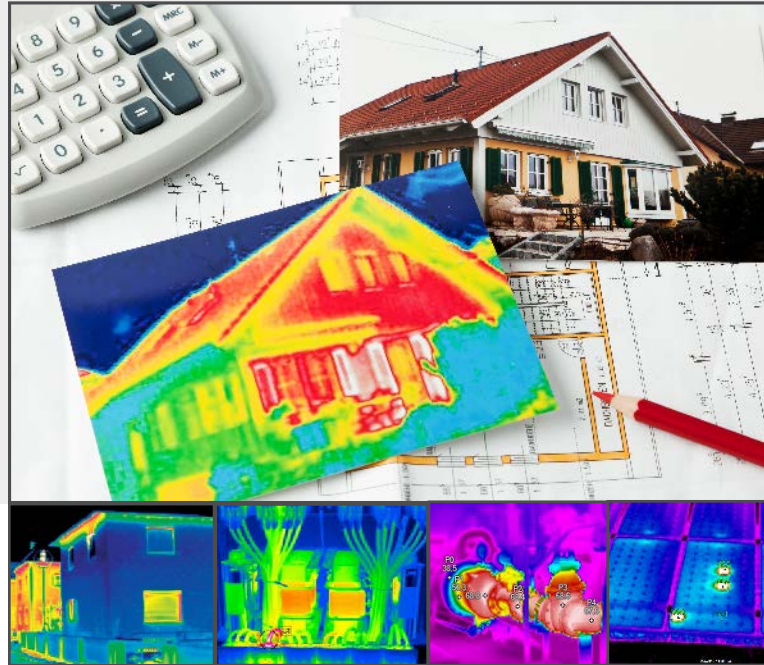
popis obr. zleva: tepelné mosty, elektrický rozvaděč, rozvody tepla v kotelně, vadné fotovoltaické panely